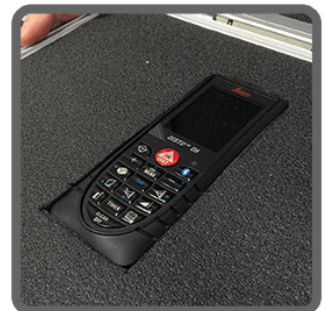
Krok 4 Umieść swój przedmiot

KYOTO Tool Foam to kolejny świetny produkt zaprojektowany w celu osiągnięcia maksymalnej organizacji i kontroli wzrokowej w obszarze roboczym oraz ochrony naszych cennych przedmiotów w kufrach lub walizkach. Doskonale służy również jako tablica cieni, gdzie w przypadku braku któregoś elementu lub narzędzia, pusty, biały cień na gąbce natychmiast informuje nas o jego braku czy odstępstwie od standardu.