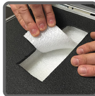
Krok 3 Usuń warstwę pianki