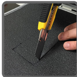
Krok 2 Wytnij nożykiem po obrysie