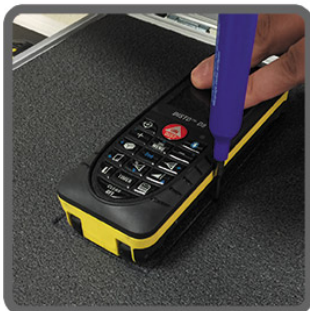
Krok 1 Obrysuj markerem przedmiot

Gąbka klastrowa, wielowarstwowa KYOTO Tool Foam typu Cut'n'Pell (z ang. wytnij i oberz) w systemie 5S do samodzielnego formowania miejsc na przedmioty w walizce lub kufrze w celu zapewnienia skutecznej ochrony przed drganiami i uszkodzeniami mechanicznymi. Klastrowa budowa gąbki umożliwia bardzo łatwe jej wycięcie nożykiem uniwersalnym i wydłubanie gąbki na żądany wymiar celem zrobienia przestrzeni na nasz przedmiot, który chcemy zabezpieczyć. Do pomocy posłuż nam jedynie ostry nóż oraz specjalny marker dostępny w naszym sklepie tutaj . Jakość i precyzja wycięć zależy tylko od Twoich umiejętności manualnych. W celu osiągnięcia dokładniejszych wycięć, sugerujemy użycie dwóch nożyków z ostrzami 9 mm i 18 mm powszechnie dostępnych w każdym sklepie DIY (z ang. Do It Yourself).